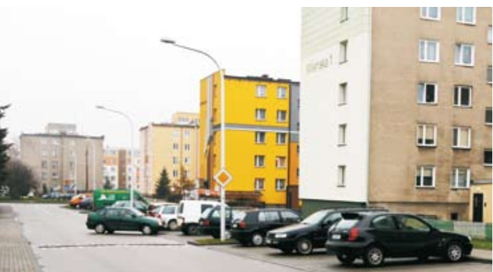
Przy ul. Wileńskiej powstało 16 nowych miejsc parkingowych.

Trwają już końcowe prace budowlano-remontowe przy ulicy Wileńskiej. Wkrótce pojawią się tam dodatkowe miejsca postojowe wraz z oświetleniem i odwodnieniem.