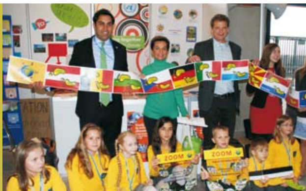
Ełccy uczniowie wśród uczestników szczytu klimatycznego.

Uczniowie Szkoły Podstawowej nr 4 wzięli udział w spotkaniu z przedstawicielami delegacji międzynarodowej konferencji klimatycznej ONZ w Warszawie. W ramach akcji „Zoom – Kids on the Move” dzieci odbyły symboliczną, ekologiczną podróż dookoła świata, która zakończyła się uczestnictwem w „szczyście klimatycznym”.