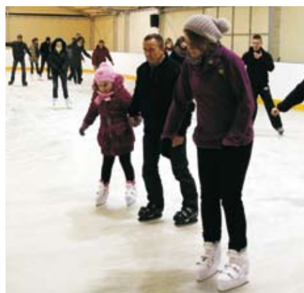
Lodowisko funkcjonuje już 3 sezon.

Więcej informacji można uzyskać w MOSiR Elk, tel (087) 610 38 38 wew. 41, lub na stronie www.mosir.elk.com.pl .