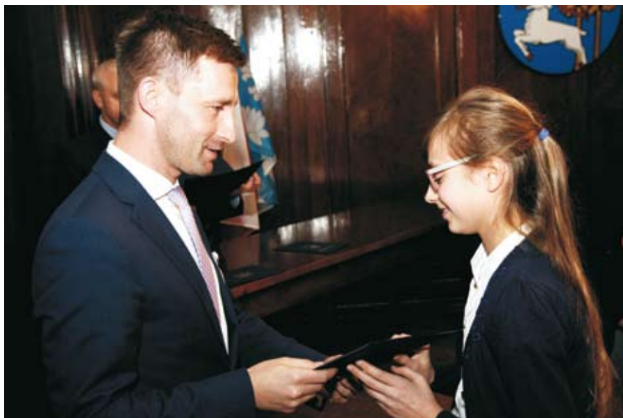
Prezydent Elku wręczył stypendia 34 najlepszym uczniom miejskich szkół.

Stypendia o wartości: 100 zł, 150 zł oraz 200 zł miesięcznie za aktywność społeczną i wyniki w nauce przyznane zostały 34 najlepszym uczniom pobierającym naukę w miejskich szkołach. Tym razem nagrodzono: 17 uczniów szkół podstawowych, 16 uczniów szkół gimnazjalnych oraz jednego ucznia Liceum Ogólnokształcącego