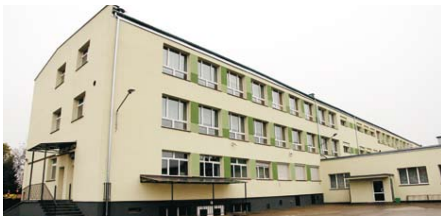
Budynek Zespołu Szkół Samorządowych w Ełku po zakończonej termomodernizacji.