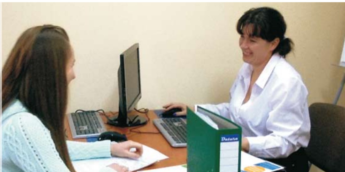
Biuro Wspierania Przedsiębiorczości pomaga osobom, które chcą rozwijać swój biznes.

Przy ul. Małeckich 3 w Ełku działa Biuro Wspierania Przedsiębiorczości, które oferuje bezpłatne doradztwo bezrobotnym ełczanom zainteresowanym rozpoczęciem własnej działalności gospodarczej. Udzielana jest również pomoc w ramach projektu „Mój cel – przedsiębiorczość”.