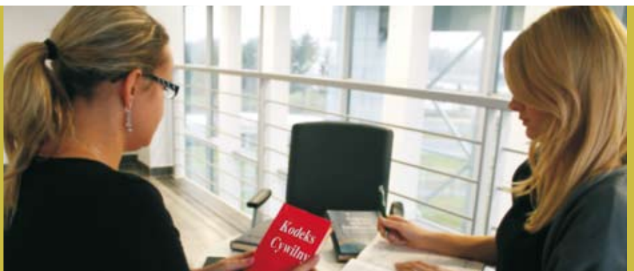
Ełccy przedsiębiorcy mogą skorzystać z porad wykwalifikowanego doradcy.

W centralnej części znajdzie się hol główny wraz z kasami, poczekalnią dla podróżnych, toalety, informacja turystyczna, a także pomieszczenie przeznaczone na prowadzenie działalności komercyjnej. W skrzydle zachodnim zaprojektowano hostel (parter i piętro). Będzie się on składał z 13 pokoi (2x1-osobowe, 7x2-osobowe, 4x3-osobowe) oraz 1 apartamentu (pokój dzienny oraz 3 pokoje z niezależnymi łazienkami). Na parterze znajdzie się pokój jednoosobowy z łazienką dostosowany do wymogów osób niepełnosprawnych. Tu usytuowane będą również aneks kuchenny i pokój śniadaniowy oraz recepcja. W skrzydle wschodnim przewidziano miejsce na świetlicę, pomieszczenia sanitarne i magazy-