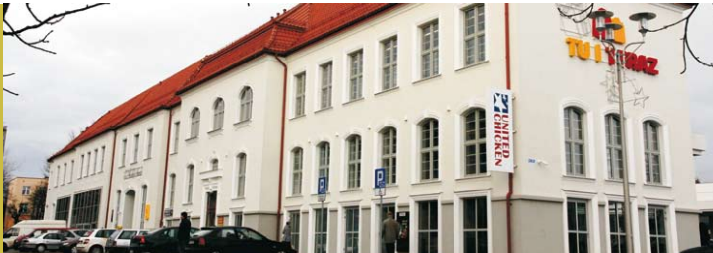
Dawny zrujnowany budynek szpitala miejskiego zmienił się nie do poznania.

Park handlowy „Tu i Teraz” w końcu został otwarty. Po wielu latach w centrum miasta zniknął szpecący widok nadpalonych ruin dawnego szpitala miejskiego. Teraz mieszkańcy Ełku mogą robić zakupy we własnej małej galerii usytuowanej u zbiegu ulic Mickiewicza i Gdańskiej. Otwarcie jednego z największych obiektów handlowych w naszym mieście miało miejsce w grudniu.