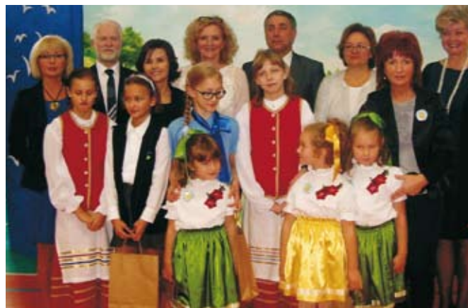
Ełccy laureaci Certyfikatów „Szkoła Przyjazna Środowi- sku”.

tor Przedszkola. Dzięki współpracy z zewnętrznymi organizacjami i przedsiębiorstwami, m.in. Centrum Edukacji Ekologicznej, Przedsiębiorstwem Wodociągów i Kanalizacji, czy Przedsiębiorstwem Gospodarki Odpadami „Eko-Mazury” dzieci mogły również od strony praktycznej dowiedzieć się jak chronić środowisko.