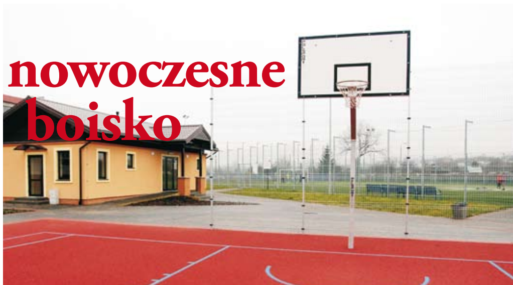
To kolejne boisko wielofunkcyjne w Elku ze sztuczną (poliuretanową) nawierzchnią.

Pod koniec października zakończono budowę wielofunkcyjnego boiska przy Szkole Podstawowej nr 9 w Elku na osiedlu Konieczki. Było to przedsięwzięcie realizowane w ramach wspólnego projektu Elku i litewskiego miasta Alytus.