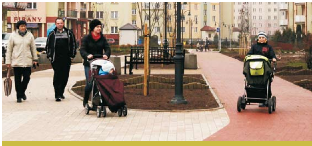
Od kilku tygodni mieszkańcy os. Jeziorna korzystają z nowego ciągu pieszo-rowerowego.

- Pierwszy etap wykonaliśmy już 3 lata wcześniej. Teraz możemy się cieszyć z zakończenia etapu drugiego –