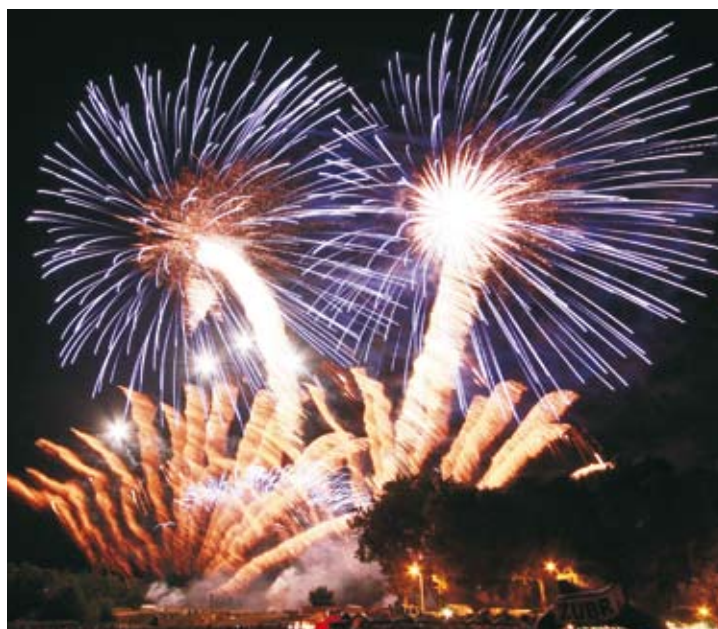
Jak co roku można liczyć na efektowny pokaz fajerwerków.

Miejski sylwester zdążył wpisać się już w tradycję Elku. Zapraszamy zatem wszystkich elczan i gości na Plac Jana Pawła II. Jak co rok wspólnie powitamy Nowy Rok na świeżym powietrzu. W tym roku przybyłych na Sylwestra „pod chmurką” rozgrzewać będą rockowe i popowe utwory znanego już elczanom zespołu Flash Creep, a także DJ. Początek imprezy planowany jest na godzinę 23. Tuż przed północą Prezydent Elku złoży życzenia zebrany na Placu. Następnie – pod rozświetlonym gwiazdami niebem – zebrani będą mogli kontynuować zabawę podziwiając przygotowany przez miasto profesjonalny pokaz sztucznych ogni. Po północy będzie można bawić się dalej przy muzyce zespołu Flash Creep, a potem Dj Radeckiego. Impreza zakończy się o godz. 1.