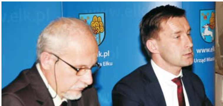
Prezydent Elku i Skarbnik Miasta zaprezentowali nowy budżet.

nieformalnych grup mieszkańców mogą ubiegać się o dofinansowanie przedsięwzięć związanych z najbliższym otoczeniem budynku: wykonanie zieleńców, placów zabaw, zakup ławek, koszy, poprawa elewacji itd.