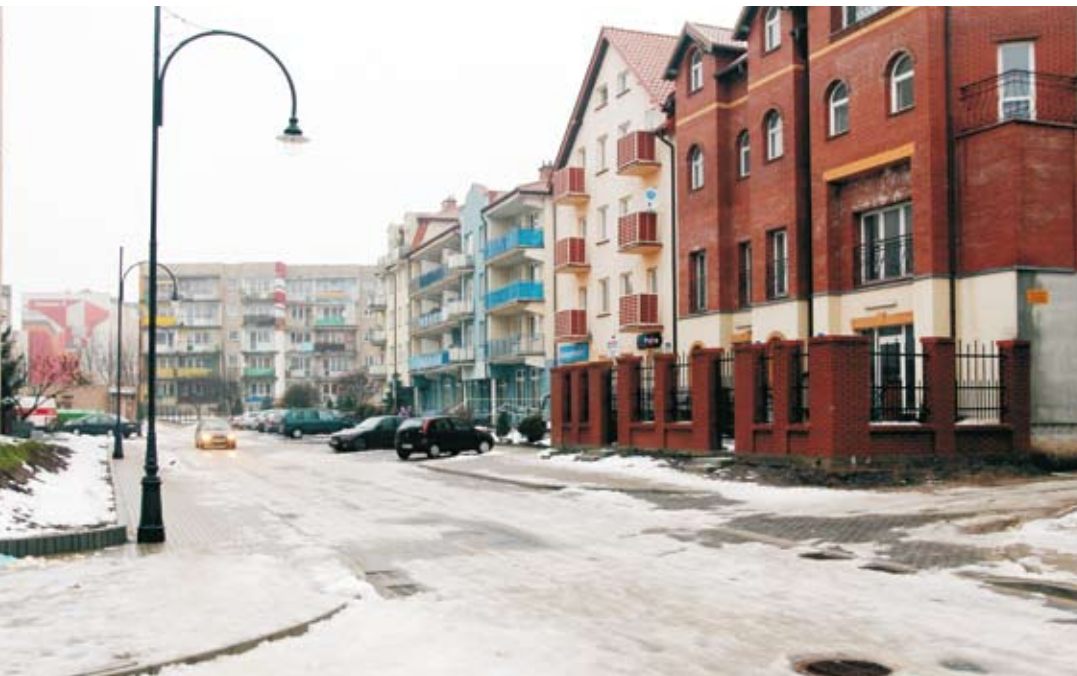
Przejazd tym fragmentem ul. Wawelskiej jest już bezpieczny.