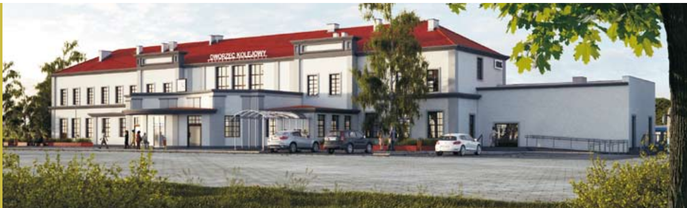
Już w przyszłym roku tak będzie wyglądał zmodernizowany budynek dworca głównego PKP w Elku.

nowe. Powierzchnia piętra przeznaczona będzie dla Służb Ochrony Kolei. W budynku zaprojektowano również dźwig wewnętrzny do transportu osób niepełnosprawnych oraz ekip ratowniczych.