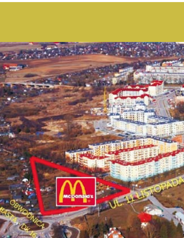
McDonald's powstanie w Ełku w 2014 r.

Firma Mc Donald's Polska stała się właścicielem działki miejskiej przeznaczonej pod inwestycje usługowo-handlowe. Prawdopodobnie już w połowie przyszłego roku w naszym mieście w pobliżu ronda przy ul. 11 Listopada powstanie restauracja McDonald's. Znajdzie w niej zatrudnienie ok. 30-40 osób, a w sezonie letnim dwukrotnie więcej.